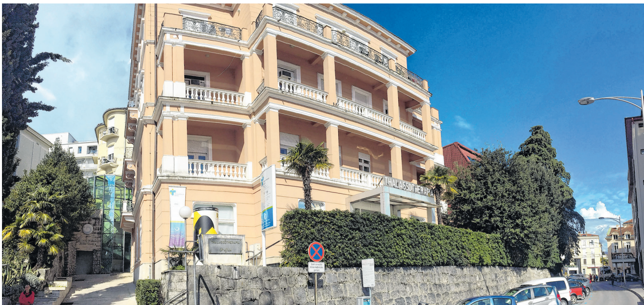
Najvažnije je pacijentima donijeti svjetlost u živote - Thalassotherapy Opatija

- Velika pažnja usmjerena je na centralizaciju županijskih zdravstvenih ustanova koja bi se trebala provesti u sklopu najavljenih reforme zdravstvenog sustava koja u konačnici ima cilj održivost, dostupnost i bolju kvalitetu zdravstvenog sustava. Naravno da je bilo za očekivati reakcije sadašnjih